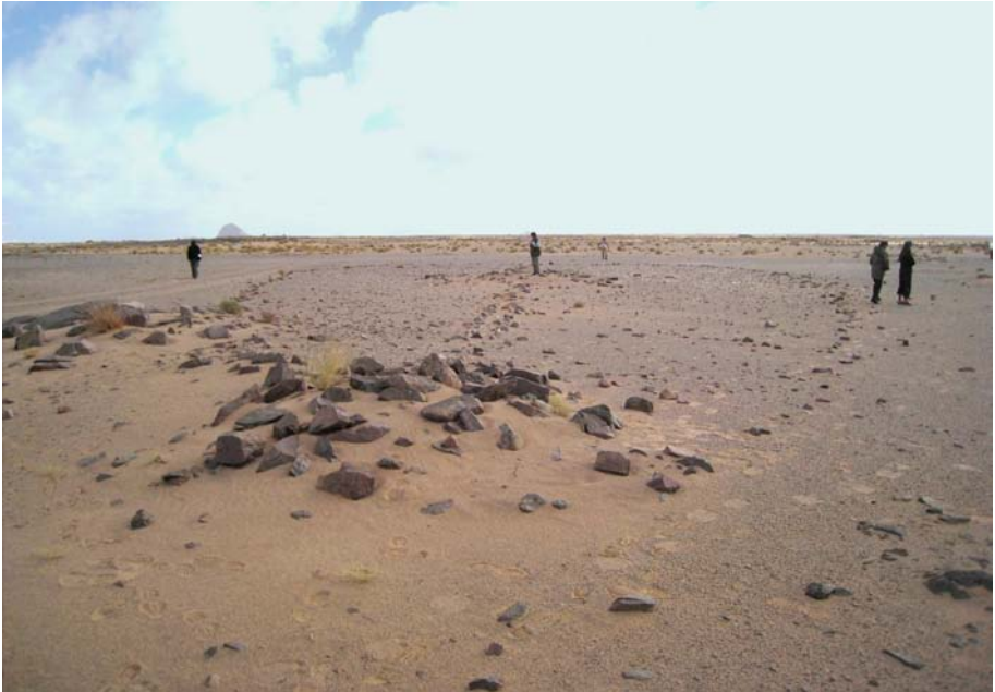
Fig.1 - El goulet de Tingefuf, parte meridional de la región del Tiris, RASD.

Por último, conviene añadir que, salvo los restos óseos descritos, ningún otro elemento o material arqueológico fue controlado en el transcurso del sondeo.